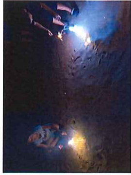
夜の海岸でお楽しみの花火

毎年恒例、志賀町大島での2泊3日の林鐘園キャンプ。今年の例年がない猛暑にはいつも以上に体力を奪われましたが、子どもも大人も海水浴や釣りなどを目いっぱい楽しむことができました。5・6年生は自分たちの力でバスと電車を乗り継ぎ、中学生はデント張りや片付けに大活躍。小さな子ども들도どんできることが増え、「みんな頼もしくなったなあ」と感じるキャンプでした。