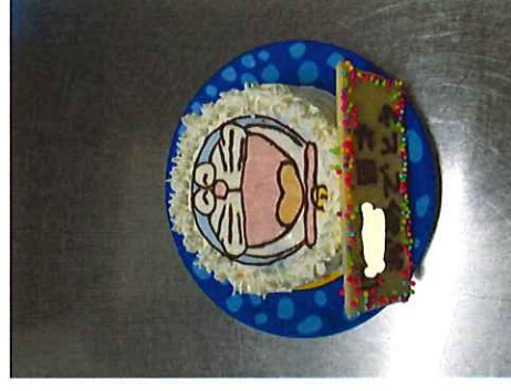
リクエストメニュー・