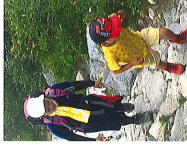
頂上目指して・・・