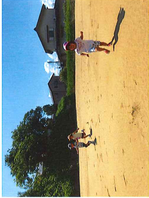
完成した林鐘園運動公園で遊ぶ子どもたち（金沢市若松町）