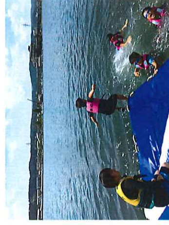
夏休み行事・「水辺の体験」 （七尾市）