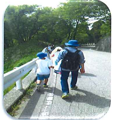
オリエンテーリングの様子